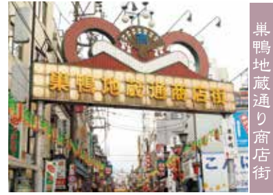
巢鴨地蔵通り商店街

巢鴨地蔵通り商店街は長さ凡そ800Mにわたる商店街で、加盟している商店数は約170店舗。 とげぬき地蔵尊縁日(4の日)には片側に200近くの露天商が立ち並びます。 「ぶらり・お参り・ゆつたり・巢鴨」に表現できる人々の安らぎ空間であるとともに、生活空間として日々活況にあふれた商店街。