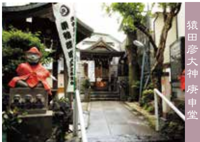
猿田彦大神 庚申堂

江戸時代には中山道の立場(休憩所)として、「江戸名所図会」にもその賑わいが描かれている「巢鴨庚申塚」。現在の庚申堂に鎮座する庚申塔には、再興された明暦3年(1657)の文字が見えます。さらに、文献によるとさらに、一世紀以上時代をさかのぼる「文亀2年(1502年)」の碑もその下に埋められているというので、その歴史の古さが理解できることでしょう。堂には猿田彦大神も合祀されています。(申は「さる」であることから、日本では庚申堂には猿田彦神を祀ることが多くなっています)