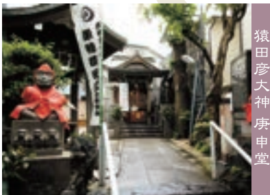
猿田彦大神 庚申堂