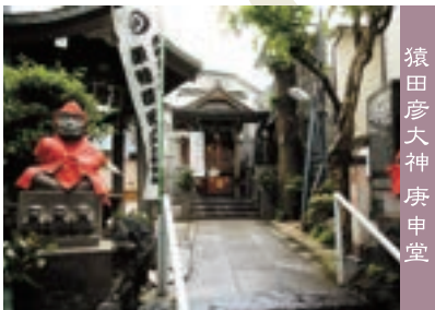
猿田彦大神 庚申堂