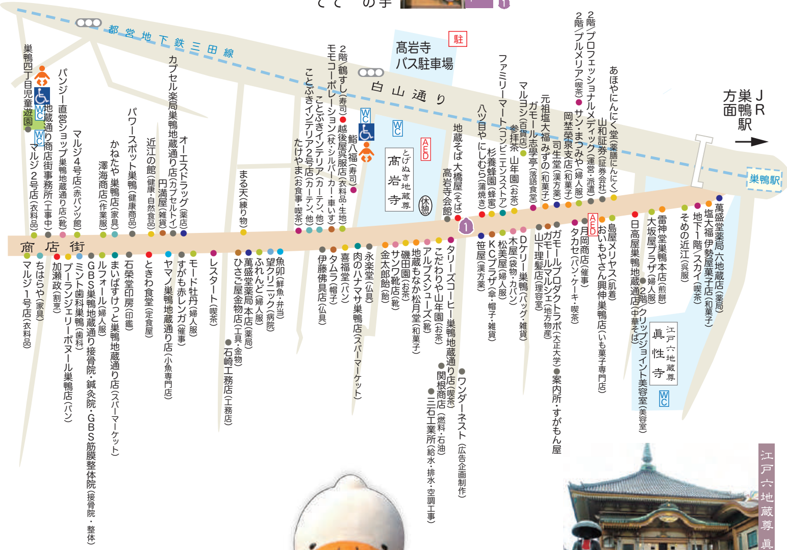
江戸六地藏尊 眞性寺

お蕎麦屋さんのお手伝いするすがもんのトリックアート。落としてさうになっているお蕎麦を支えてあげて!