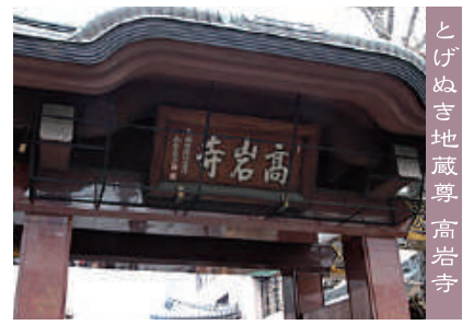
とげぬき地藏尊 高岩寺

商店街の中央部に鎮座する曹洞宗萬頂山高岩寺は、「とげぬき地藏尊」という名で親しまれている名刹です。江戸幕府の開府以前の慶長元年(1596年)に、現在の外神田二丁目で開創され、60年後、下谷屏風坂に移転。そして、現在ある巢鴨には明治24年(1891年)に移ってきました。ご本尊であり「とげぬき地藏」として靈験あらたかな延命地藏尊(秘仏)は、多くの善男善女から信仰を集めています。また、境内の「洗い観音(聖観世音菩薩)」は、水をかけ、自分の悪いところを洗うと治るといふ信仰が生まれ、今は2代目の観音様を布で洗うようになっています(初代は後部の厨子に納められています)。