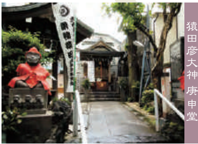
猿田彦大神 庚申堂