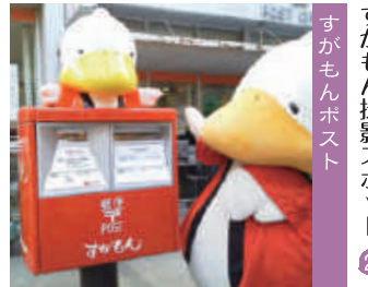
すがもん撮影スポット 2